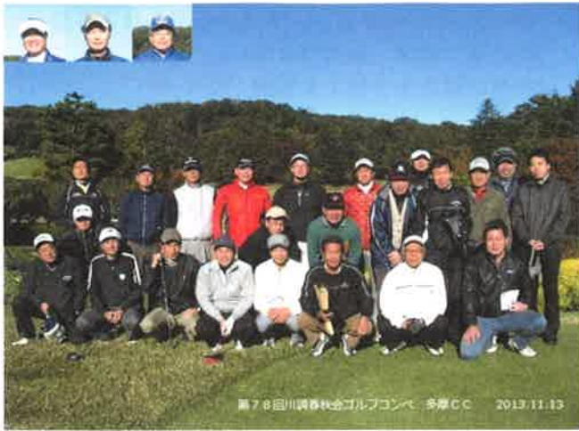
第 7 8 回川崎県ゴルフコンペ 多摩CC 2013.11.13